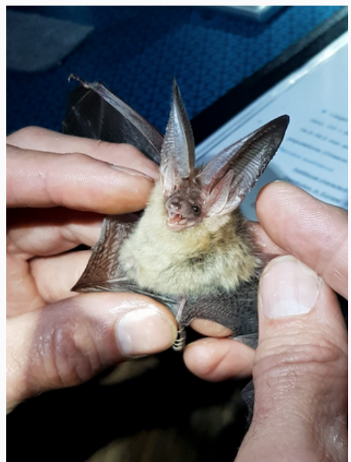
Illustration : Oreillard gris

À ce stade, l'étude a permis de mettre en avant l'utilisation des étables comme terrain de chasse pour de nombreuses espèces de chauves-souris dont certaines n'avaient jamais été détectées dans ce type d'habitat de chasse en région wallonne. Grâce à l'implication de Natagriwal, ce projet est en outre une très belle occasion de sensibiliser les agriculteurs, notamment en matière d'usage d'antiparasitaires ou de pesticides afin de préserver les zones de chasse, mais également d'accueil des chauves-souris dans les bâtiments d'élevage.