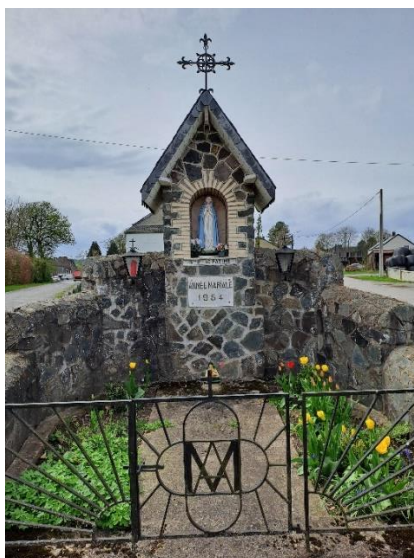
Chapelle mariale Notre-Dame de Fatima