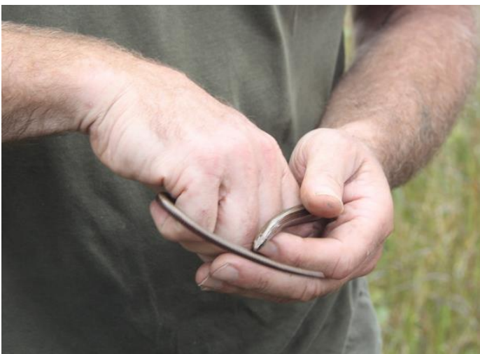
Orvet fragile - Anguis fragilis