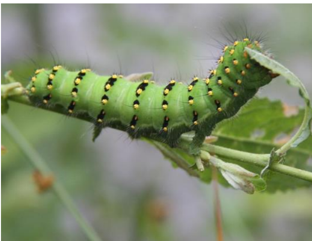
Petit paon de nuit - Saturnia pavonia