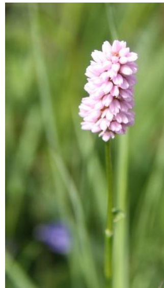
Renouée bistorte - Polygonum bistorta

Le 2 août, chantier de gestion de la réserve de Vis Prés à Rienne.