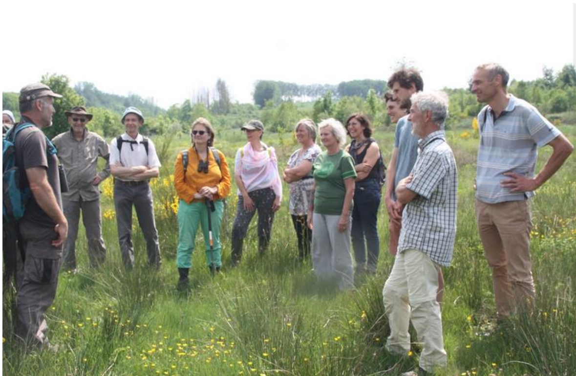
Première visite de réserve

La réunion de lancement du 14 avril 2021 a rassemblé 18 personnes et débouché sur la redynamisation de la régionale L&H le 23 mai 2021, avec à la clef la signature de la Convention autour de 9 personnes.