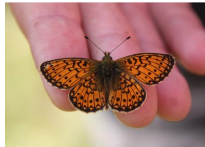
Nacré de la bistorte - Boloria eunomia